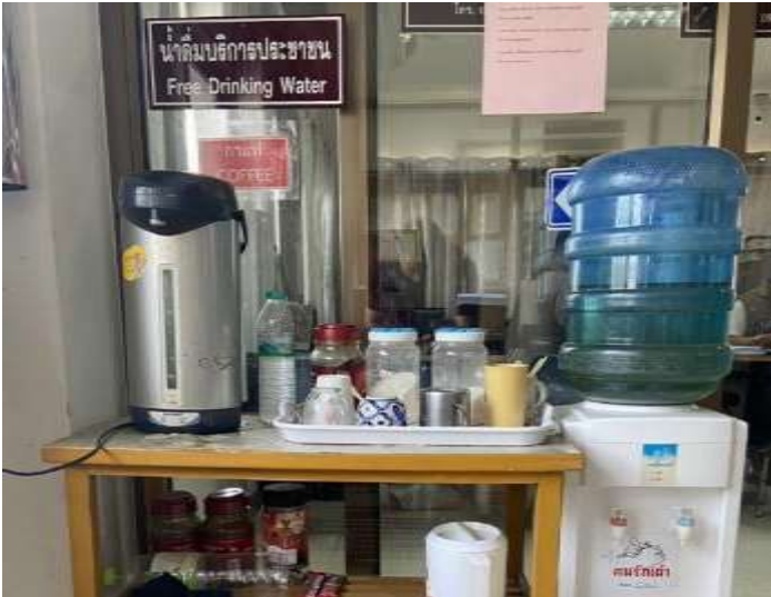
น้ำดื่มบริการประชาชน